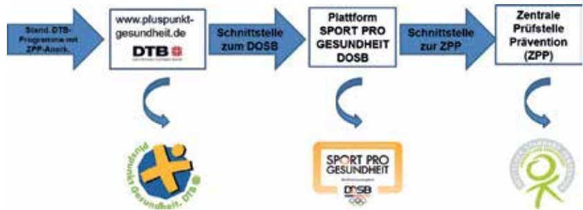
Abb.5: Verfahrensweise der ZPP-Anerkennung für Pluspunkt-Angebote

Die genehmigten Anträge für den Pluspunkt mit ZPP-Anerkennung fließen über eine Schnittstelle in die SPORT PRO GESUNDHEIT DOSB-Serviceplattform und von dort aus wiederum über eine Schnittstelle zur ZPP, wo sie wie alle anderen registrierten Angebote für die Krankenkassen in einer allgemeinen Datenbank abrufbar sind. Es gibt keine gesonderte Datenbank für Qualitätssiegel-Angebote mehr.