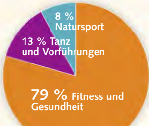
Vereinsangebote nach GYMWELT-Bereichen *

Die Befragung der BTB-Vereine der GYMWELT-Kampagne im Januar 2017 * ergab, dass der Schwerpunkt der GYMWELT-Angebote in den Vereinen mit rund 79 Prozent aller Angebote klar auf dem Bereich „Fitness und Gesundheit“ liegt. Der Bereich „Tanz und Vorführungen“, zu dem auch alle Showgruppen und Spielmansszüge zählen, liegt mit 13 Prozent noch vor „Natursport“ (8 Prozent) mit Angeboten wie Wandern, Schneesport oder Nordic Walking.