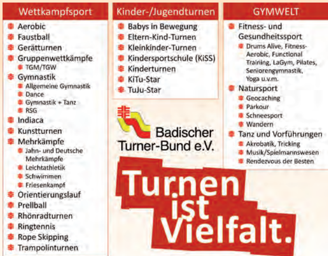
Wettkampfsport, Kinder-/Jugendturnen und GYMWELT: die drei starken Säulen in den Turn- und Sportvereinen des Badischen Turner-Bundes